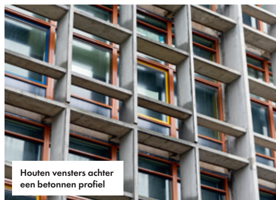
Houten vensters achter een betonnen profiel

School: Cygnus Gymnasium Plaats: Amsterdam Aantal leerlingen: bijna 800 Locatiedirecteur: Freek Op 't Einde Architecten (1956): Commer de Geus en Ben Ingwersen Architect renovatie (2012): Wessel de Jonge Bijzonderheden: dit gebouw is een uiting van het Brutalisme, een stroming in de architectuur die is begonnen bij het flatgebouw Unité d'Habitation van Le Corbusier in Marseille.