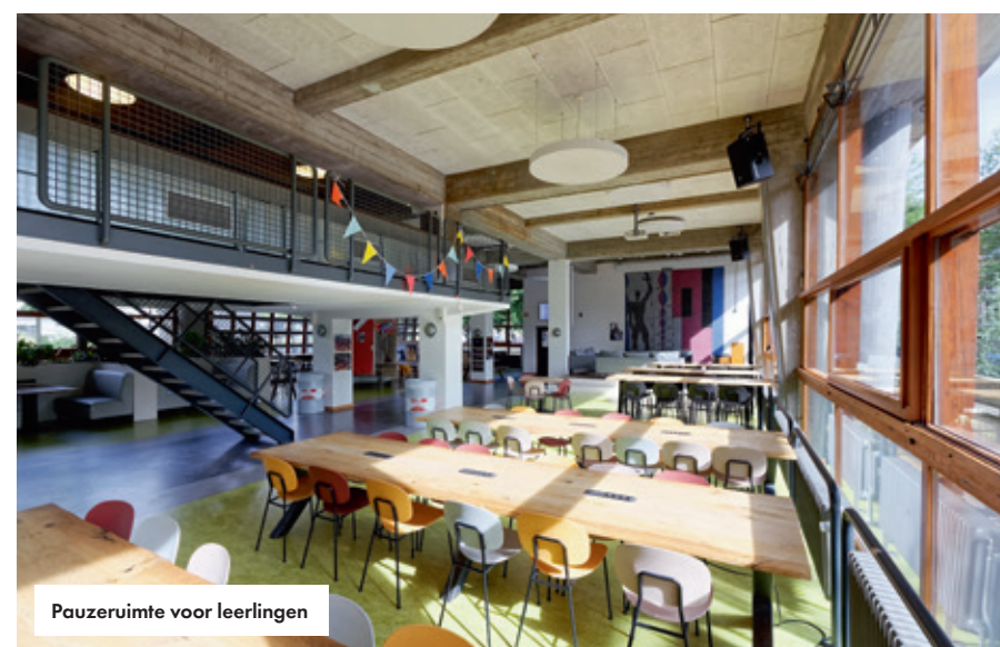
Pauseruimte voor leerlingen