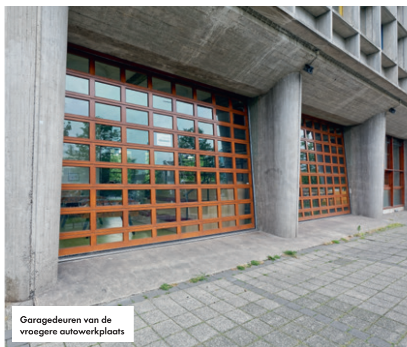
Garagedeuren van de vroegere autowerkplaats