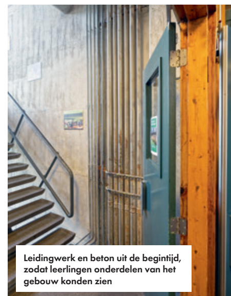
Leidingwerk en beton uit de begintijd, zodat leerlingen onderdelen van het gebouw konden zien